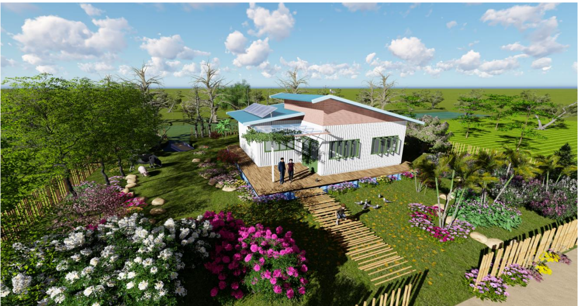
PHỐI CẢNH 2: Ngôi nhà gắn liền với thiên nhiên