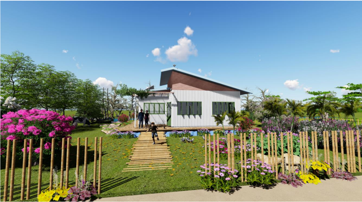
PHỐI CẢNH 1