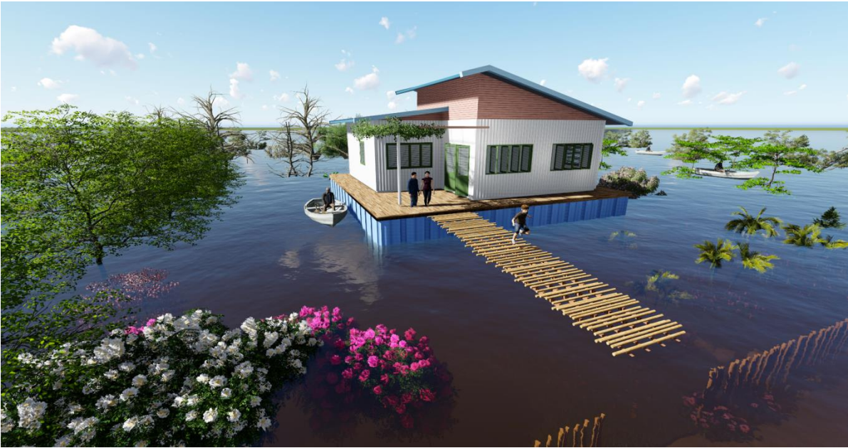
PHỐI CẢNH 3: ( Ngôi nhà tác động bởi lũ từ tháng 8 và kéo dài đến tháng 11 )